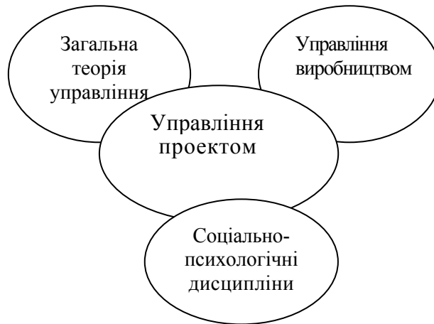
Рис. 1.1. Схема взаємозв'язку різних сфер галузей знань про управлінську діяльність

З цього можна зробити загальні висновки: